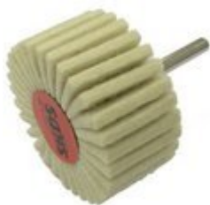
Filcová tělíska se stopkou